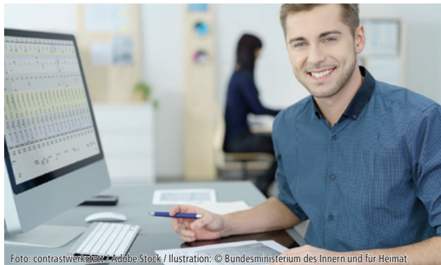
Illustration: © Bundesministerium des Innern und für Heimat

chen. Andererseits konnten Fachverbände wie der Deutsche Steuerberaterverband e.V. (DStV) die Regelungen inhaltlich auf ihre Praxistauglichkeit prüfen und dem Ministerium Rückmeldung geben. Nun ist das finale Einführungsschreiben erschienen (BMF, Schreiben vom 15. Oktober 2024, Gz. III C 2 – S 7287-a/23/10001 :007). Dabei hat das Finanzministerium viele der Anregungen aus der Praxis ins finalisierte Schreiben aufgenommen.